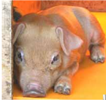
人気のベーコン 焼き豚